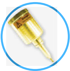
3 mm elektryczna