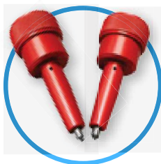
3 - 6 mm dot