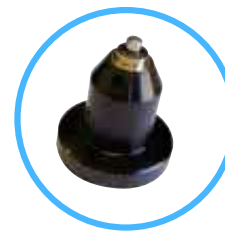
6 mm for ASM6090