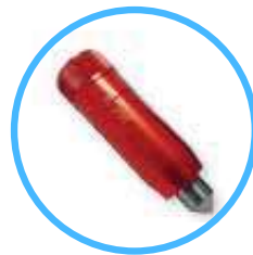
18 mm dot