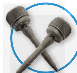
3 - 6 mm XL dot