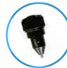
4 mm vibro