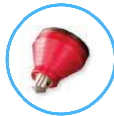
16 mm for ASM40150

Znakowanie kontaktowe - Ciche znakowanie